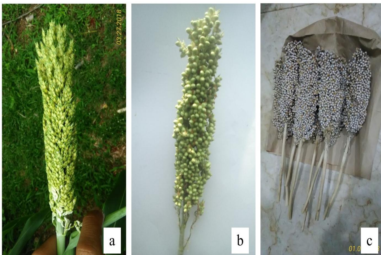
Gambar 1. Penampakan malai pada penentuan fase flowering (a), soft dough (b) dan hard dough (c)

Benih sorgum ditanam pada area 20x60 cm dengan kedalaman 5-6 cm. Pemupukan diberikan pada hari ke-7 HST (hari setelah tanam) berupa urea, TSP ( tri sodium phosphate ) dan KCl ( potassium chloride ) dengan rasio 2:3:2 (g/g/g) sebanyak 210 kg/ha. Pemupukan kedua menggunakan 140 kg/ha urea pada hari ke-30 HST. Pemanenan dilakukan pada fase generatif flowering (70 hari HST), soft dough (95 HST) dan hard dough (115 HST) (Gambar 1). Perbedaan fase generatif dilihat pada penampakan malai (Gambar 1). Tanaman sorgum yang dipanen, dipisahkan menjadi tiga bagian (batang, daun dan malai) kemudian dikeringkan pada suhu 60 °C selama 48 jam dan digiling pada ukuran 1 mm untuk dilakukan analisis serat dan FTIR.